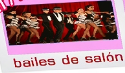
bailes de salón

Lugar Centro Cultural Grupos 1. Martes de 17h30 a 18h30 De 9 a 12 años 2. Jueves de 17h30 a 18h30 De 5 a 8 años