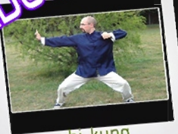
chi-kung para mayores

Lugar Centro Cultural Grupo 1. Martes y Viernes de 10h00 a 11h00